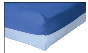
Inkl. hochwertigem PU-Vollbezug

E-Mail: info@adl-gmbh.de Internet: www.adl-gmbh.de